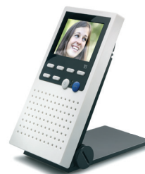
ecoos auf Tischzubehör