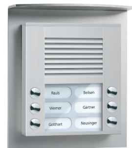
Außenstation PES06-EN auf Montageplatte