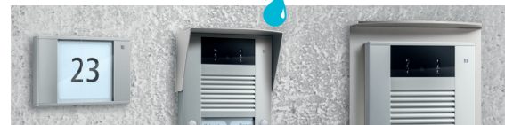
Infefeldmodul Wetterschutzdach Montageplatte (auf Anfrage)

Infefeldmodul, Wetterschutzdach oder Montageplatte einfach montiert Im Format 90 x 135 x 20 mm kann das hinterleuchtete Infefeldmodul im Design der Außenstation bündig anschließend oder auch abgesetzt auf Putz platziert werden. Das Wetterschutzdach wird als Zubehör klebend auf der Außenstation angebracht. Die Montageplatte zur Aufputzmontage von Außenstationen auf unebenem Untergrund ist auf Anfrage in individueller Länge erhältlich.