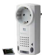
SmartSlot und Funksignalgerät