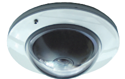
Domekamera zur Unterputzmontage FVK4221-0

Bei Fragen zur Planung nutzen Sie die Beratung der technischen Hotline 0 41 94 - 988 11 88 (deutsches Festnetz)