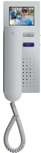
Innenstation mit Hörer IVH3222-0140

Bei Fragen zur Planung nutzen Sie die Beratung der technischen Hotline 041 94 - 988 11 88 (deutsches Festnetz)